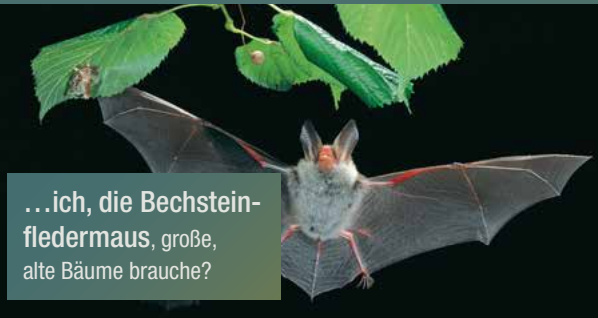
...ich, die Bechsteinfledermaus, große, alte Bäume brauche?