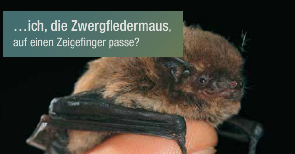
...ich, die Zwergfledermaus, auf einen Zeigefinger passe?