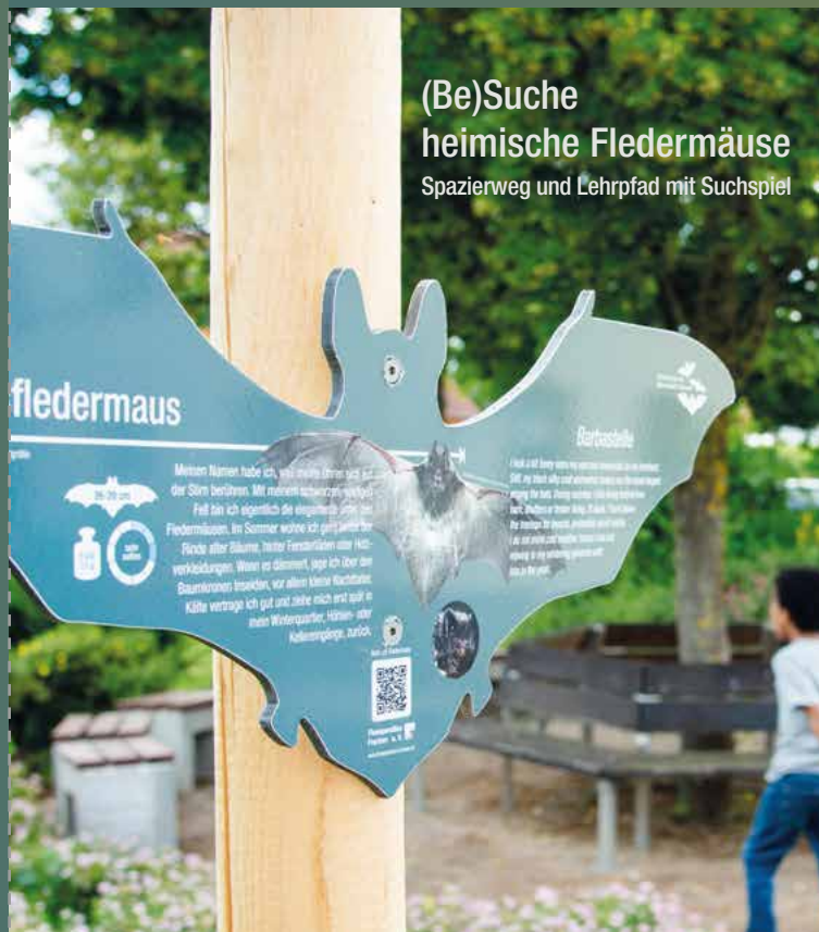
(Be)Suche heimische Fledermäuse Spazierweg und Lehrpfad mit Suchspiel