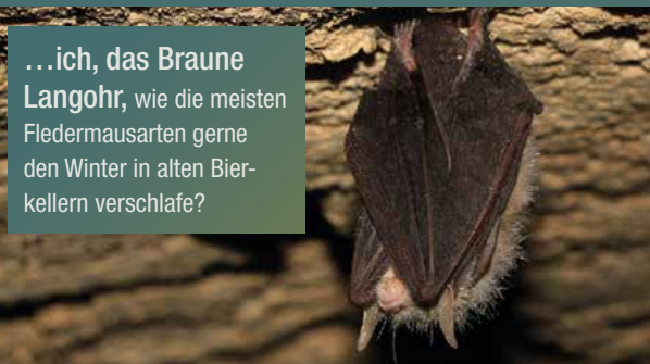
...ich, das Braune Langohr, wie die meisten Fledermausarten gerne den Winter in alten Bierkellern verschlafe?

Sowohl der Bergbräukeller am Rathaus in Viereth als auch die historische Kellergasse in Unterhaid zählen zu unseren Lieblingsrevieren. Zum Tag des offenen Denkmals 2019 gingen die Gemeinden Viereth-Trunstadt und Oberhaid deshalb die Kooperation „Kellerzweiklang“ ein. Der große Erfolg der damals durchgeführten Familienwanderung lieferte die Basis für den markierten Weg. Jetzt kannst du uns kennenlernen, wann immer du dich dafür entscheidest.